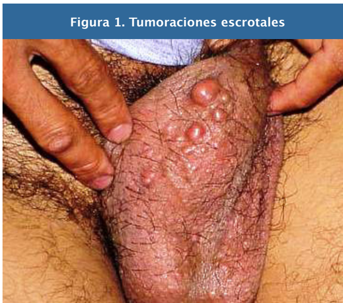
Figura 1. Tumoraciones escrotales

Clínicamente se caracteriza por la presencia de múltiples neoformaciones sobreelevadas hemiesféricas bien definidas y duras a la palpación. Son de coloración rojizo-blanquecina, de diferentes tamaños. Tienden a la agrupación y confluencia y son asintomáticas (figura 1). Tiene una evolución de 6 años con emergencia progresiva de las mismas. Ocasionalmente tras la expresión manual da salida a un escaso material nacarado de aspecto yesoso.