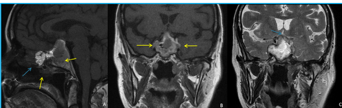
Figura 2: RM sin contraste. Sagital T1 y coronal T1 (B) y T2 (C). Silla turca aumentada de tamaño por una masa selar de 37 mm de diámetro cráneo-caudal máximo, predominantemente hiperintensa en T2 y más heterogénea en T1. Se extiende cranealmente, ocupa la cisterna supraselar y comprime el quiasma óptico (flecha azul en C).

El estudio anatomopatológico confirma el diagnóstico de macroadenoma hipofisario, de 3 x 2,5 cm, con signos de hemorragia y necrosis (apoplejía pituitaria). El estudio inmunohistoquímico muestra positividad para pancitoqueratinas (A1/A3), así como para cromogranina y sinaptofisina. No se observa positividad para las hormonas ACTH, GH, TSH,