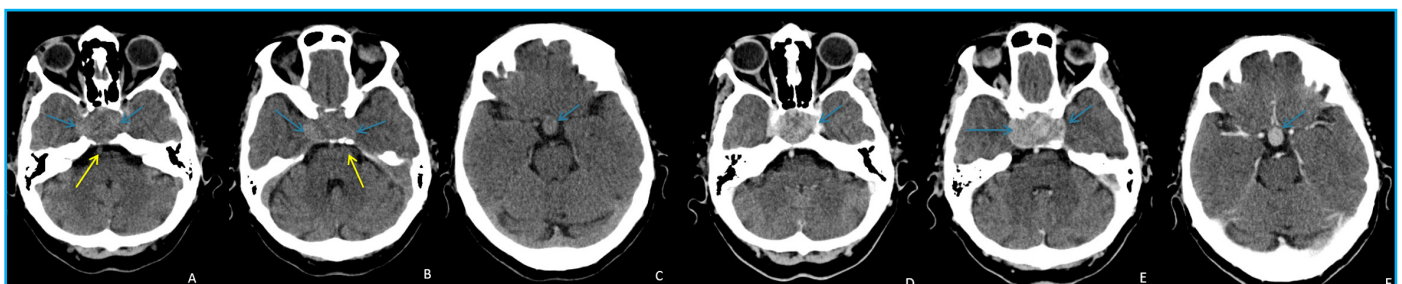
Figura 1: TC cerebral sin (A-C) y con (D-F) contraste intravenoso. Masa intraselar de 37 mm de eje transverso máximo y 24 mm de diámetro anteroposterior, de atenuación similar al parénquima cerebral, que se expande hacia los senos cavernosos lateralmente y los abomba (flechas azules en A y B), y cranealmente hacia la cisterna supraselar (flecha en C). Remodela (flecha amarilla en A) y erosiona (flecha amarilla en B) el dorso de la silla turca, que está aumentada de tamaño. Muestra realce intenso, algo heterogéneo, tras la administración de contraste (flechas D-F) que permite determinar con mayor precisión los límites del tumor.

Una resonancia magnética (RM) realizada tras esta intervención, muestra un aumento de tamaño de la silla turca, ocupada por una masa de aproximadamente 33 x 37 x 23 mm (diámetros craneo-caudal, transverso y ántero-posterior, respectivamente). La señal es hiperintensa en las secuencias potenciadas en T2 y heterogénea en las secuencias T1, con áreas hiperintensas en su interior que pueden corresponder a zonas de sangrado. La masa se extiende cranealmente y ocupa la cisterna supraselar, con compresión del quiasma óptico, y lateralmente hacia los senos cavernosos, con signos de invasión de los mismos. Adicionalmente se aprecian los cambios postquirúrgicos del abordaje transesfenoidal, con material de sellado en la nasofaringe y el seno esfenoidal, así como burbujas aéreas (figura 2). En el estudio con contraste se observa un realce periférico, sin captación en el interior de la masa, que, junto con la hiperseñal en T2, sugiere la presencia de un componente necrótico-quístico central o