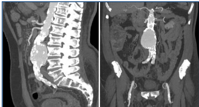
Figuras 4a y 4b. Reconstrucciones sagital y coronal de AAA en TC multidetector

No existen datos constatados para hacer extensiva esta recomendación de cribado ecográfico a la población no fumadora y no se aconseja en mujeres por el bajo número de muertes relacionadas con esta patología. Existen autores que recomiendan realizar el cribado a mujeres siempre y cuando presenten factores de riesgo como fumar, enfermedades vasculares periféricas o antecedentes familiares de AAA.