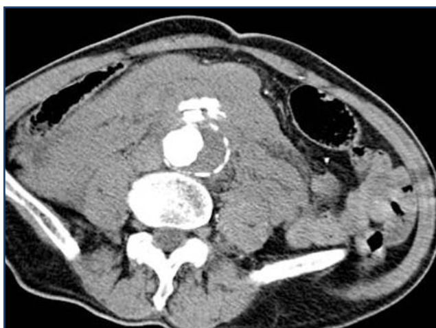
Figuras 3a, 3b y 3c. Rx abdomen: aumento de densidad en flanco, no se visualiza el psoas derecho. TC abdominal: rotura de AAA con extravasación de contraste al hematoma retroperitoneal

lugar a grandes fístulas arteriovenosas. Los síntomas incluyen taquicardia, insuficiencia cardíaca congestiva, inflamación de las piernas, thrill abdominal, soplo abdominal en maquinaria, insuficiencia renal e isquemia periférica. Pueden asimismo romperse en la cuarta porción duodenal y dar lugar a una hemorragia digestiva alta exanguinante.