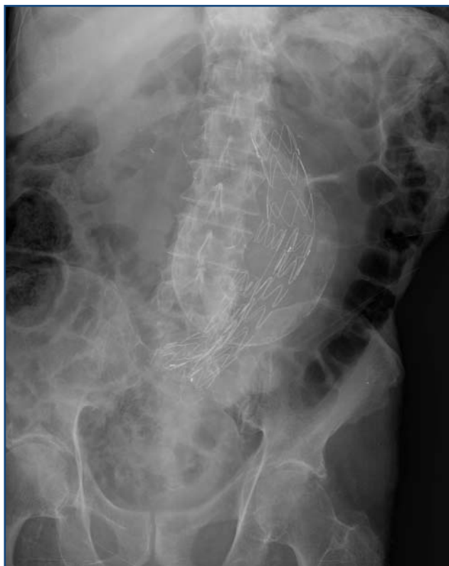
Figura 5. AAA calcificado tratado con endoprótesis

En conclusión, los datos disponibles sobre eficacia y efectividad del cribado de AAA son amplios y su realización produce una reducción significativa de la proporción de roturas y de la mortalidad específica