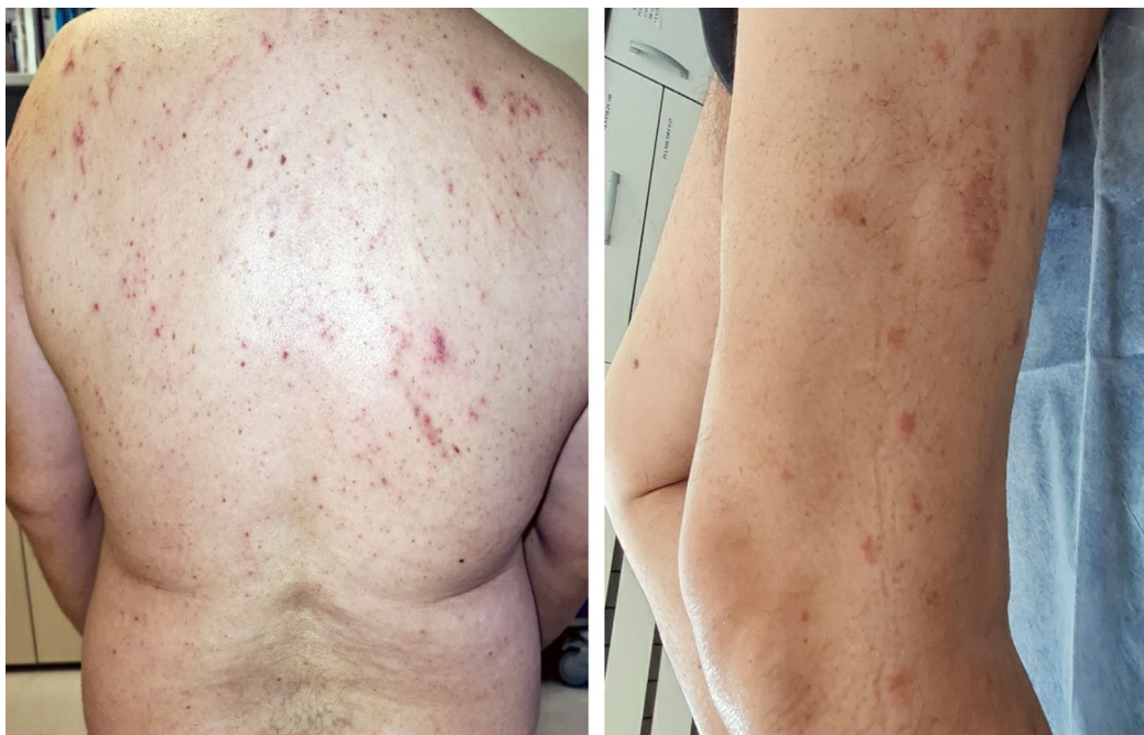
Figura 2 - Lesiones cutáneas en tronco posterior y pierna izquierda. Se aprecian múltiples pápulas eritematosas dispersas, algunas con signos de excoriación, sobre la piel del tronco y pierna izquierda. Las lesiones muestran una distribución irregular, compatible con prurito persistente y rascado repetido, en el contexto de una parasitosis cutánea como la escabiosis.

Este caso ilustra la importancia de un abordaje integral en atención primaria, que tenga en cuenta no solo los aspectos clínicos, sino también los determinantes sociales de la salud, para evitar retrasos diagnósticos y controlar enfermedades infecciosas cutáneas en poblaciones vulnerables.